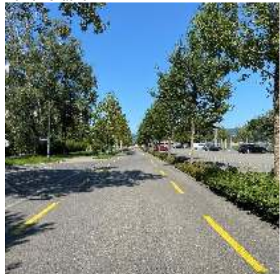
Kernfahrbahn an der Allmendstrasse