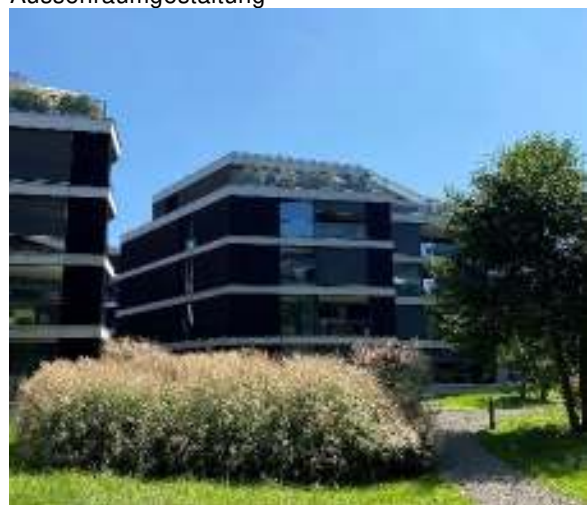
Gartenraum der Siedlung Riedpark