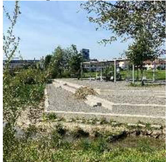
Quartierplatz im Göbli