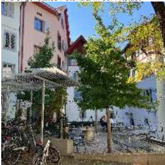
Fortunagässli, Café Pfauen