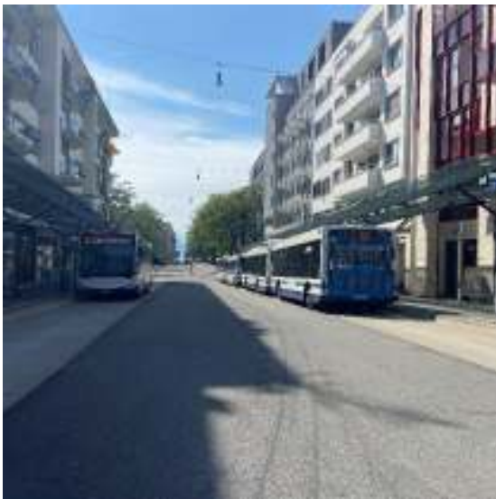
Alpenstrasse / Bahnhofplatz