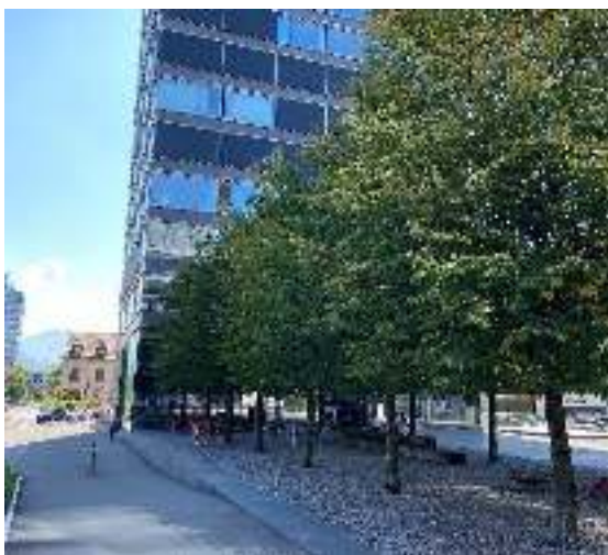
Baarerstrasse 125, baumbestandener Platz mit Aussengastronomie