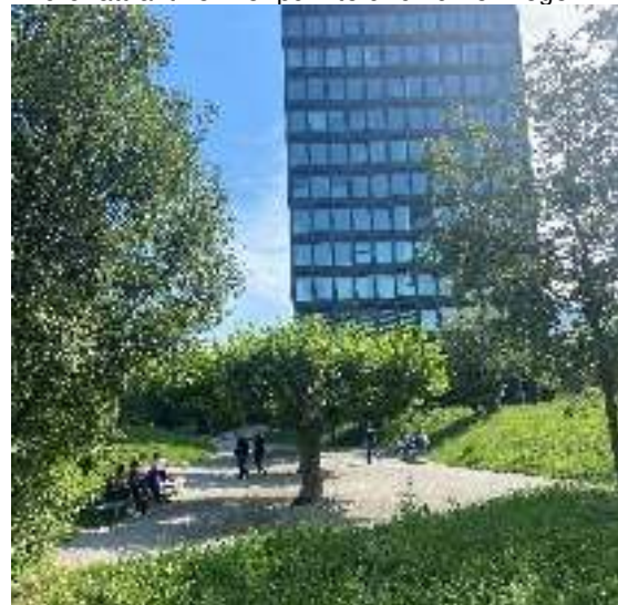
Foyer Park im LG-Areal